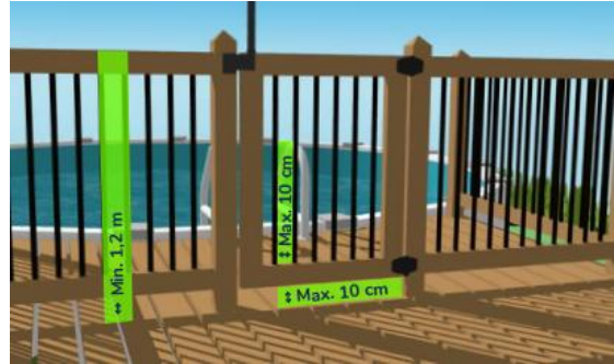
Figure 4 - Dimensions exigées pour une enceinte

*Les clôtures en mailles de chaîne doivent être lattées lorsque les mailles ont une largeur de plus de 30 mm. L'ajout de lattes doit faire en sorte de ne pas permettre le passage d'un objet sphérique de plus de 30 mm de diamètre. Cette exigence s'applique seulement aux clôtures installées ou remplacées depuis le 1 er juillet 2021.