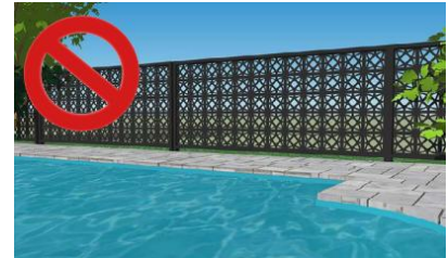
Figure 7 - Exemple de clôture ornementale qui peut être escaladée facilement.