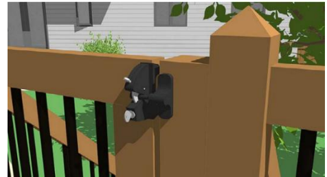
Figure 9 - Exemple de loquet permettant à la porte de se verrouiller automatiquement. La porte devrait aussi être munie de pentures à ressort afin de se refermer automatiquement.