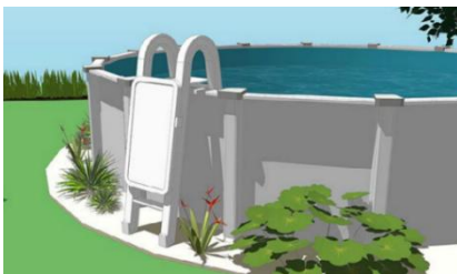
Figure 1- Exemple d'échelle munie d'une portière de sécurité