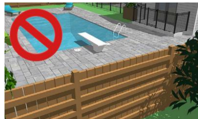
Figure 6 - Les travers horizontaux sont trop rapprochés et pourraient permettre à un enfant d'escalader la clôture.