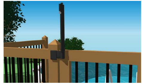
Figure 8 - Exemple de loquet pouvant être installé du côté extérieur de l'enceinte, même lorsque celle-ci mesure moins de 1,5 m de haut.

Une portière double peut être autorisée à la condition que l'une des deux portes soit maintenue en position fermée (par exemple au moyen d'une tige solidement ancrée dans le sol), sans qu'il soit possible de l'ouvrir manuellement, sans l'aide d'un outil. La deuxième porte doit quant à elle se refermer et se verrouiller automatiquement.