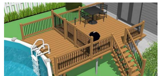
Figure 3 - Exemple de terrasse rattachant la piscine à la résidence. La clôture empêchant l'accès à la piscine doit toujours avoir au moins 1,2 m de hauteur.