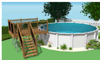
Figure 2 - Exemple de plateforme dont l'accès est protégé par une enceinte.