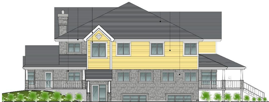
Façade latérale droite - Rue Hedgerow Right Facade - Hedgerow Street