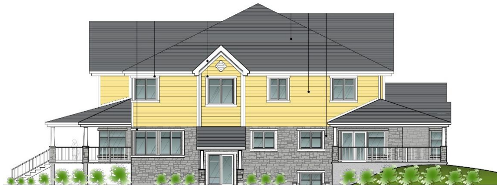
Façade latérale gauche - Ultramar Left Facade - Ultramar