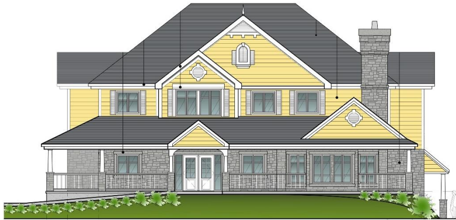
Façade - Rue du Barry Facade - du Barry Street

NOUVEAU CENTRE DE BIEN-ÊTRE DE L'OUEST-DE-L'ÎLE POUR PERSONNES ATTEINTES DU CANCER NEW WEST ISLAND CANCER WELLNESS CENTRE