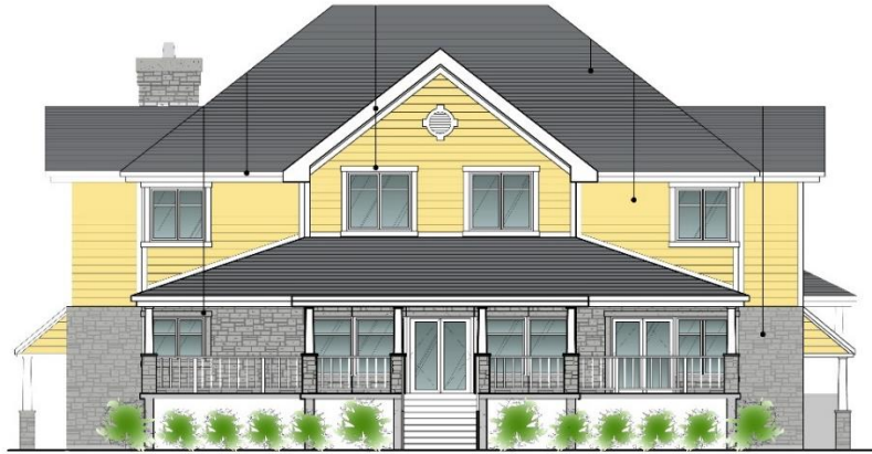
Façade arrière - IGA Rear Facade - IGA

NOUVEAU CENTRE DE BIEN-ÊTRE DE L'OUEST-DE-L'ÎLE POUR PERSONNES ATTEINTES DU CANCER NEW WEST ISLAND CANCER WELLNESS CENTRE